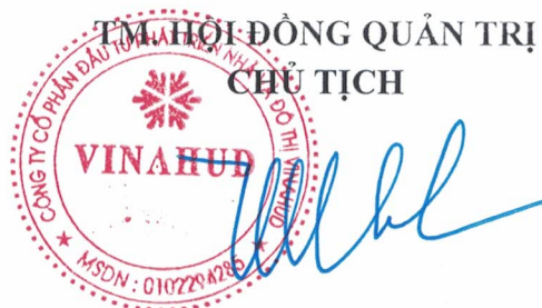
TRƯƠNG QUANG MINH